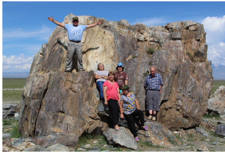
• В Горном Алтае с друзьями

Такая сложная для коллектива ситуация продолжалась довольно долго. И только в 2011 году, когда ЕВРАЗ ЗСМК ввёл дотацию на питание своим работникам, она изменилась.