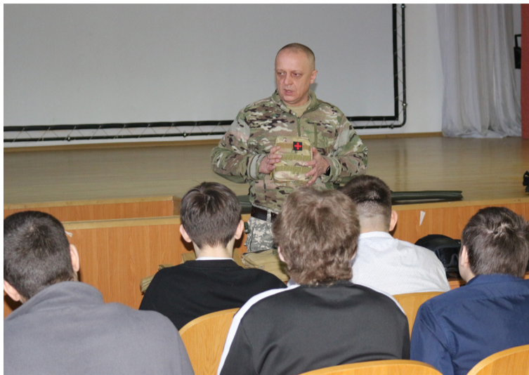
• Урок мужества в КИТ

И третье направление — встречи со студентами, школьниками, ребятами из детских домов. Мы говорим о том, чем здесь, в тылу, может помочь каждый из нас. Совсем маленькие дети, к примеру, могут нарисовать открытку,