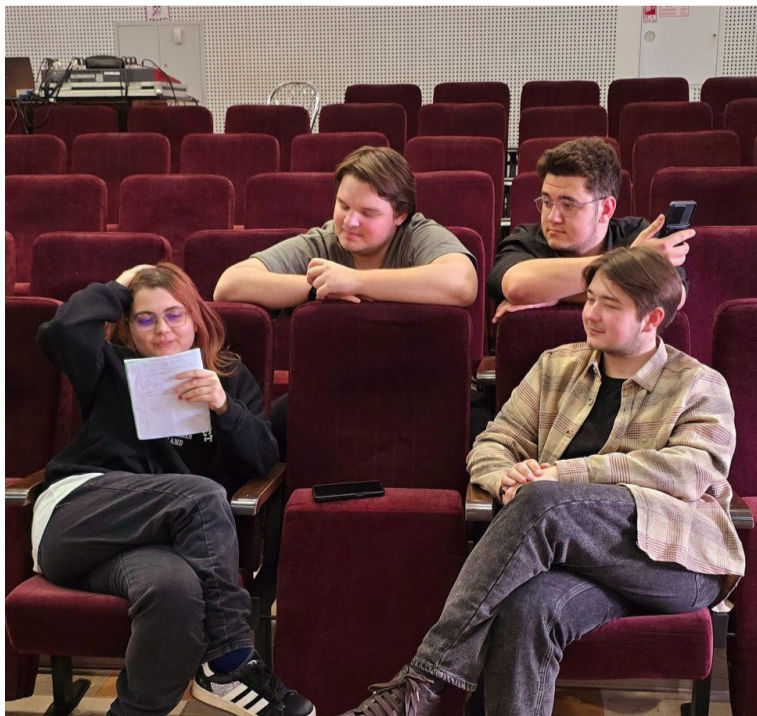
Фото участников семинара

Надеемся, что обучение поможет ребятам отлично подготовиться к Кубку КВН Кемеровской ТПО ГМПР, который пройдёт весной, и на сцене зажгутся новые звёздочки юмора.