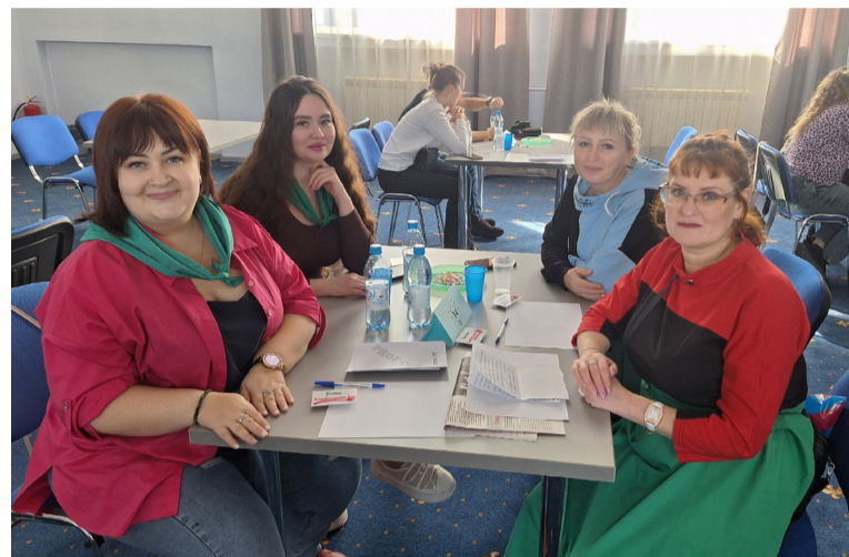
● Новички турнира – команда «Комбинация»

Ребята из нашей команды уже играли и становились призёрами, поэтому мы, конечно, были настроены оказаться в тройке лидеров, но после пер-