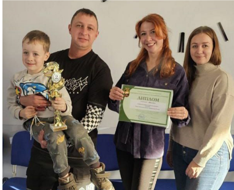
● Команда «Инсайт» хорошо провела время и стала второй

Татьяна КИТАЕВА