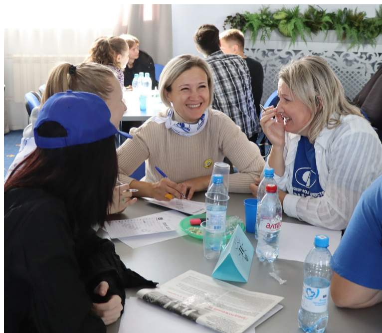
● Команда «ДРИМ ТИМ» – бронзовые призёры

Узнать песню «Третье сентября» с первых аккордов, вспомнить девиз IX съезда Горно-металлургического профсоюза России, понять логику искусственного интеллекта и угадать, какое транспортное средство встречало Ленина на Финляндском вокзале – участникам «ПрофКвиза-2024» пришлось применить знания из самых разных областей.